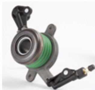
Υδραυλικό ρουλεμάν Sprinter Κωδικός Valeo 804528

Αντικαταστήστε το υδραυλικό ρουλεμάν , ακόμα κι αν η κατάστασή του φαίνεται καλή. Προλάβετε έτσι ενδεχόμενη αστοχία του μετά από λίγα χιλιόμετρα (διαρροή). Κωδικός υδραυλικού ρουλεμάν Valeo 804528 .