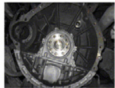
Στρόφαλος Mercedes Vito